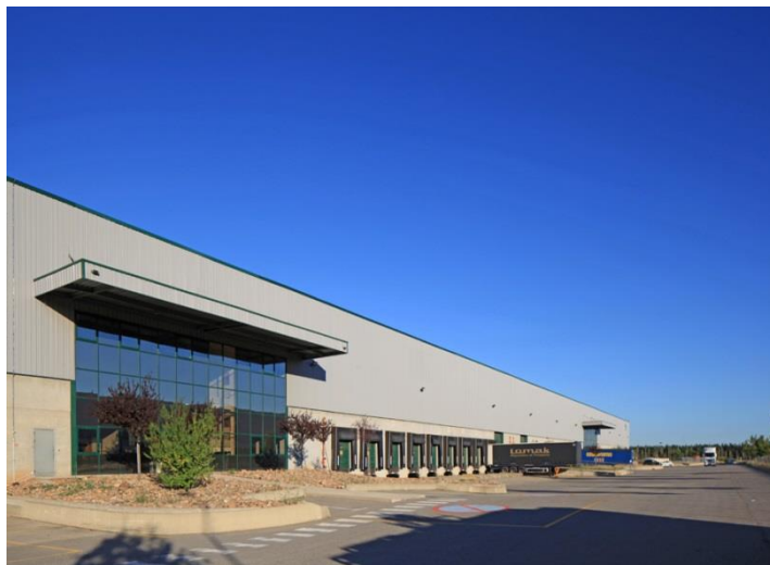
ZAC de Clesud - Rue Vasco de Gama 13140 MIRAMAS