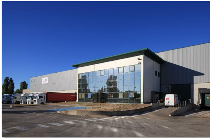
ZAC de Clésud – Avenue Magellan 13140 MIRAMAS