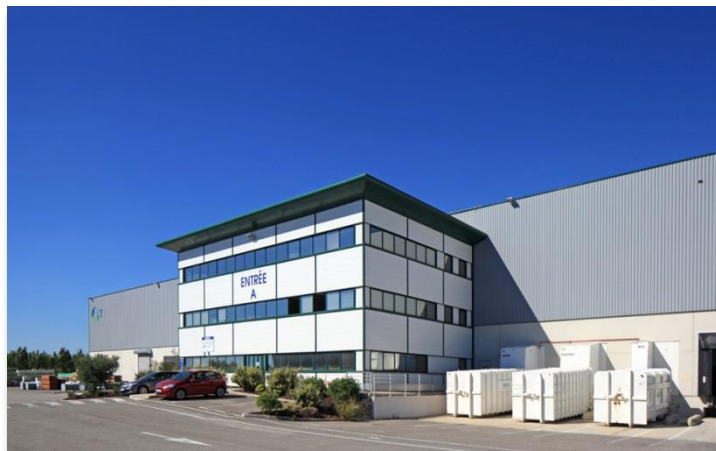
ZAC de Clesud – Rue Florence Artaud - 13450 GRANS