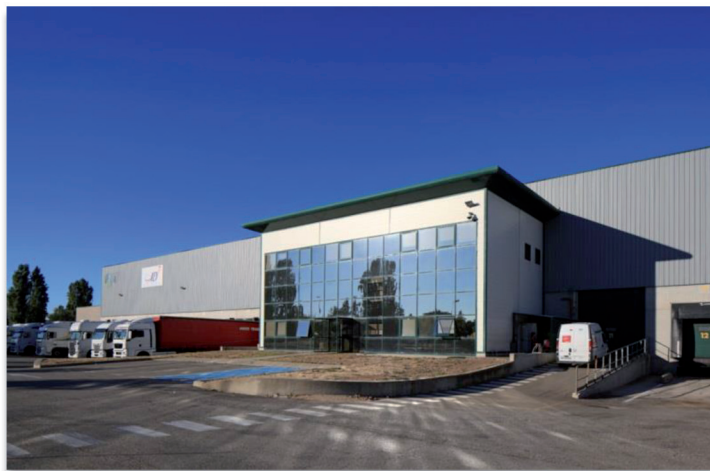
ZAC de Clésud – Avenue Magellan 13140 MIRAMAS