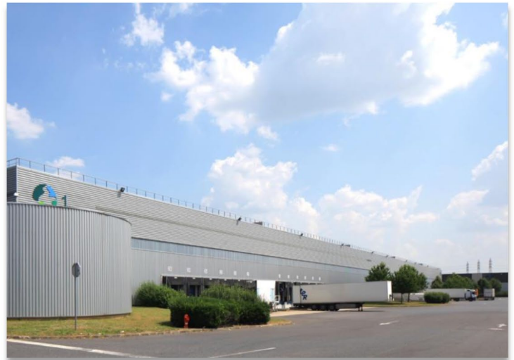
ZI de la Remise – Rue Thomas Edison 91090 LISSES