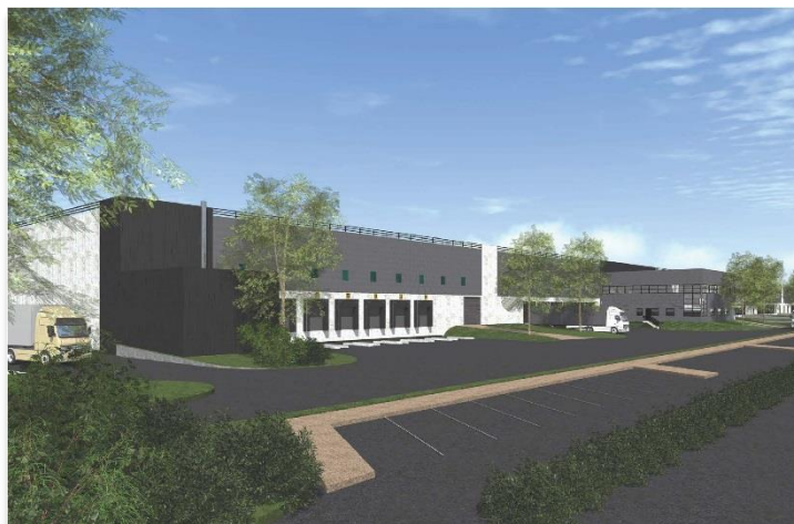
Route Industrielle 76430 St Vigor d'Ymonville