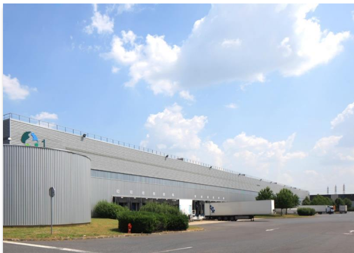
ZI de la Remise – Rue Thomas Edison 91090 LISSES