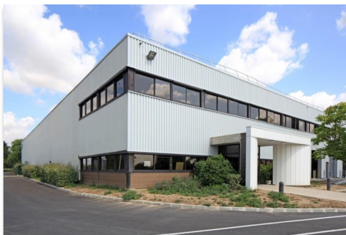
16 rue Ampère - 95500 Gonesse