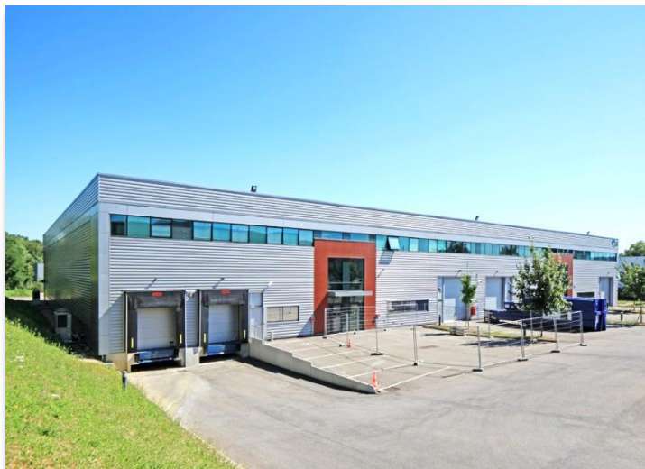
2 rue Vituve - 91140 Villebon sur Yvette