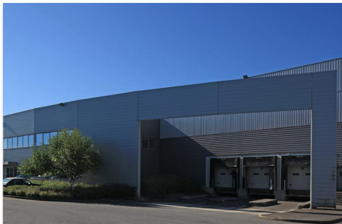
Zac la Tremblaine 2 rue de la Mare à Blot 91220 Le Plessis-Pâté