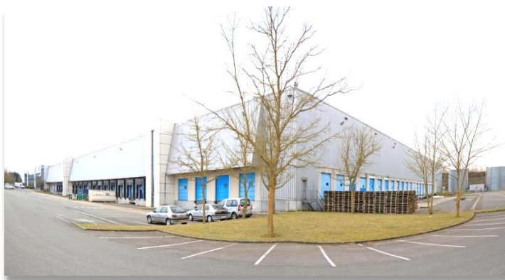
7 rue du Chrome - 77176 Savigny Le Temple