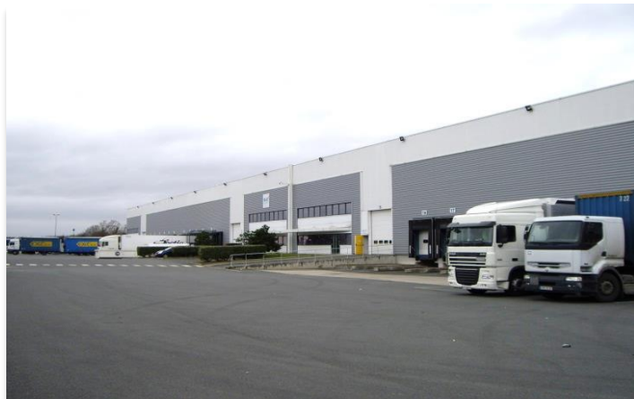
Zac des Houldres – Parisud 2 Bd d'Espagne 77127 Lieusaint