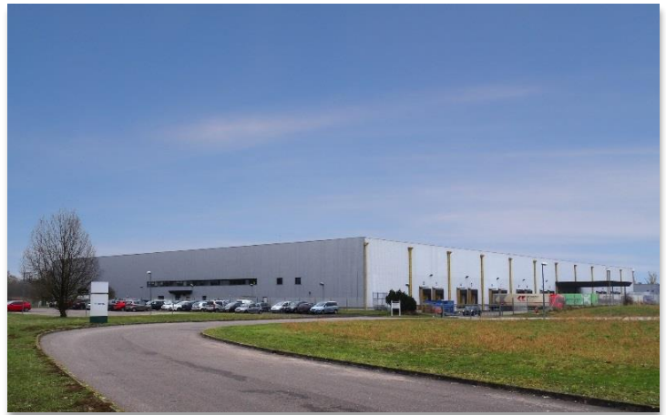
ZAC de Clesud - Rue Vasco de Gama 13140 MIRAMAS