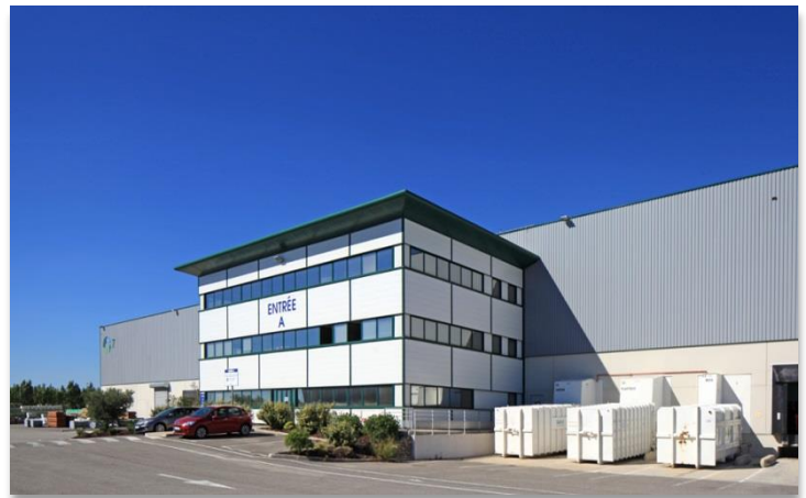
ZAC de Clesud – Rue Florence Artaud - 13450 GRANS