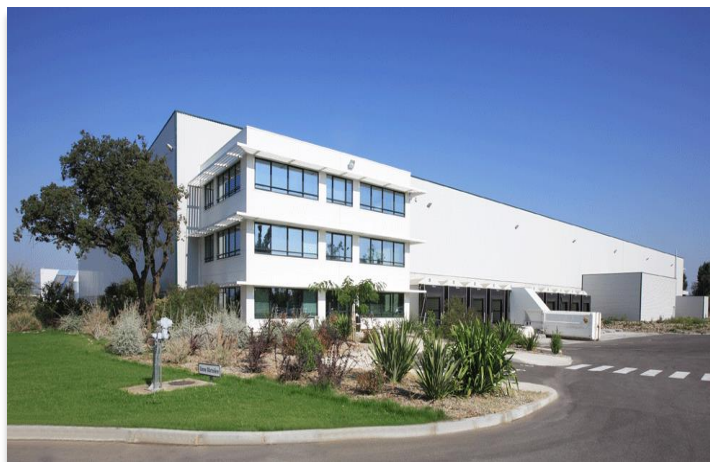
ZAC de Clésud – Avenue Ferdinand Magellan 13140 MIRAMAS