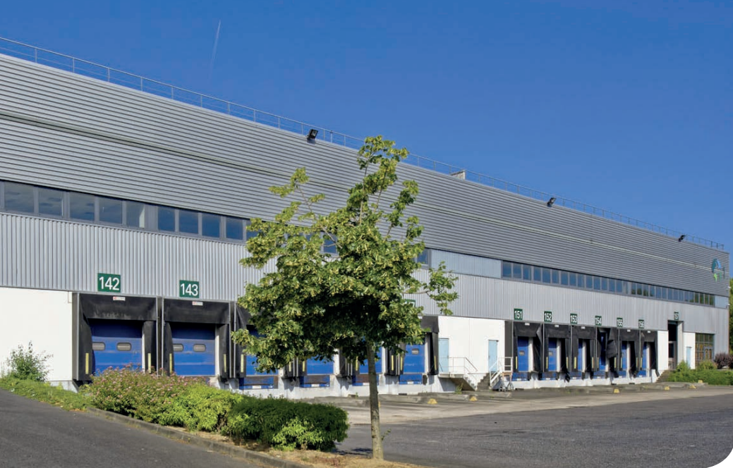
Evry DC 1