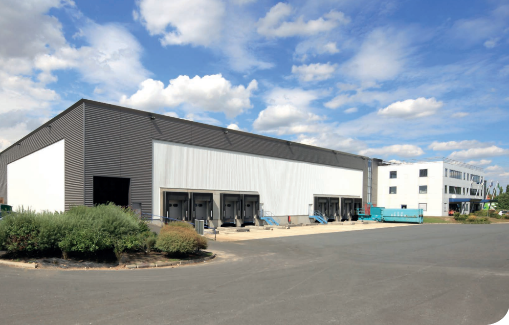
Cergy DC 2