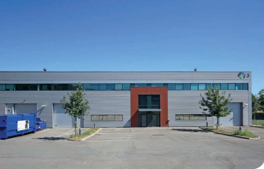
Orly DC 3