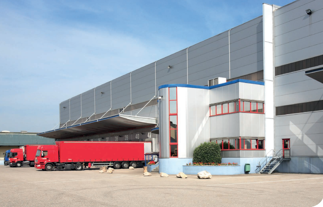
Lyon - Isle d'Abeau DC 12