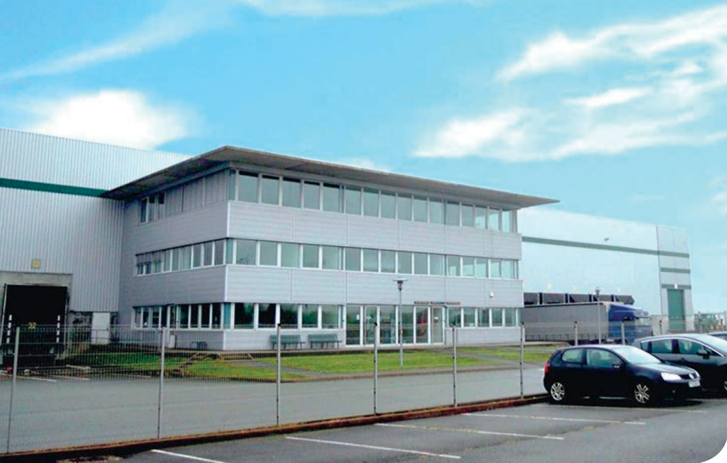
Belfort DC 1