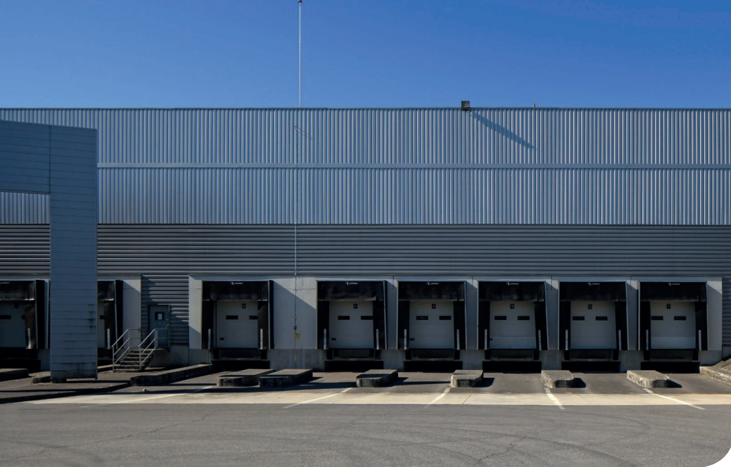
Plessis-Pâté DC 2