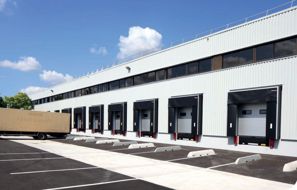
Gonesse DC 3