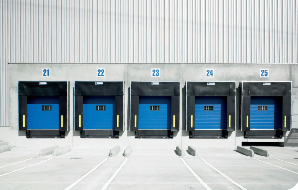
Port de Rouen DC 1