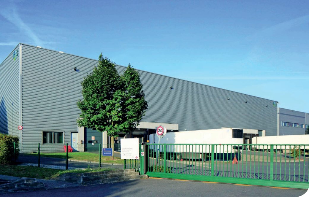
Paris Nord 2 DC 2