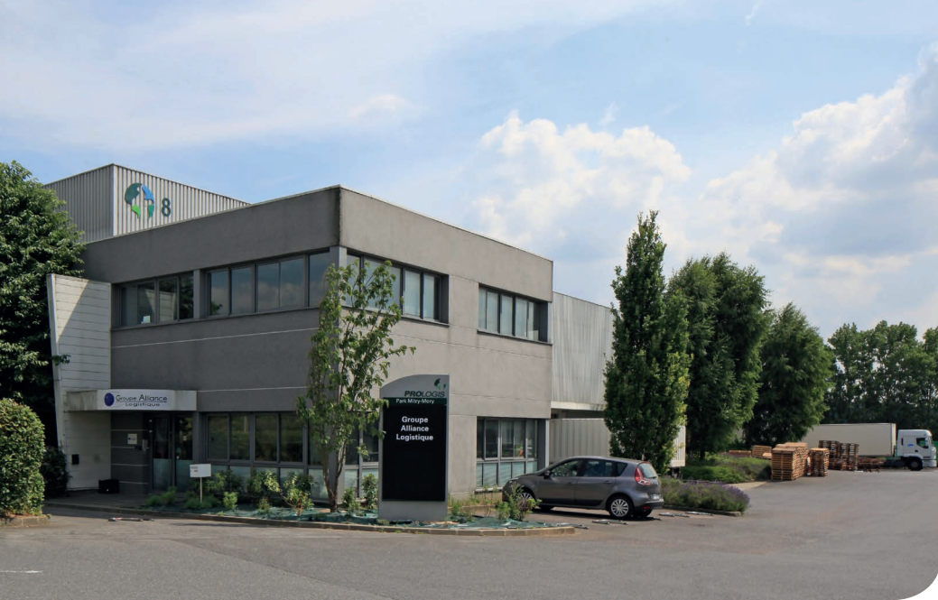
Mitry DC 8