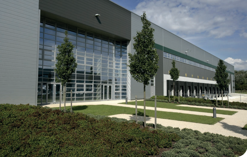
Moissy DC 2