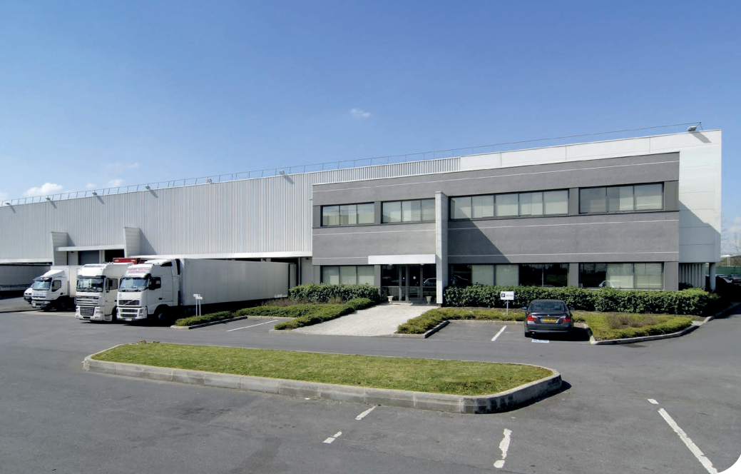
Mitry DC 9