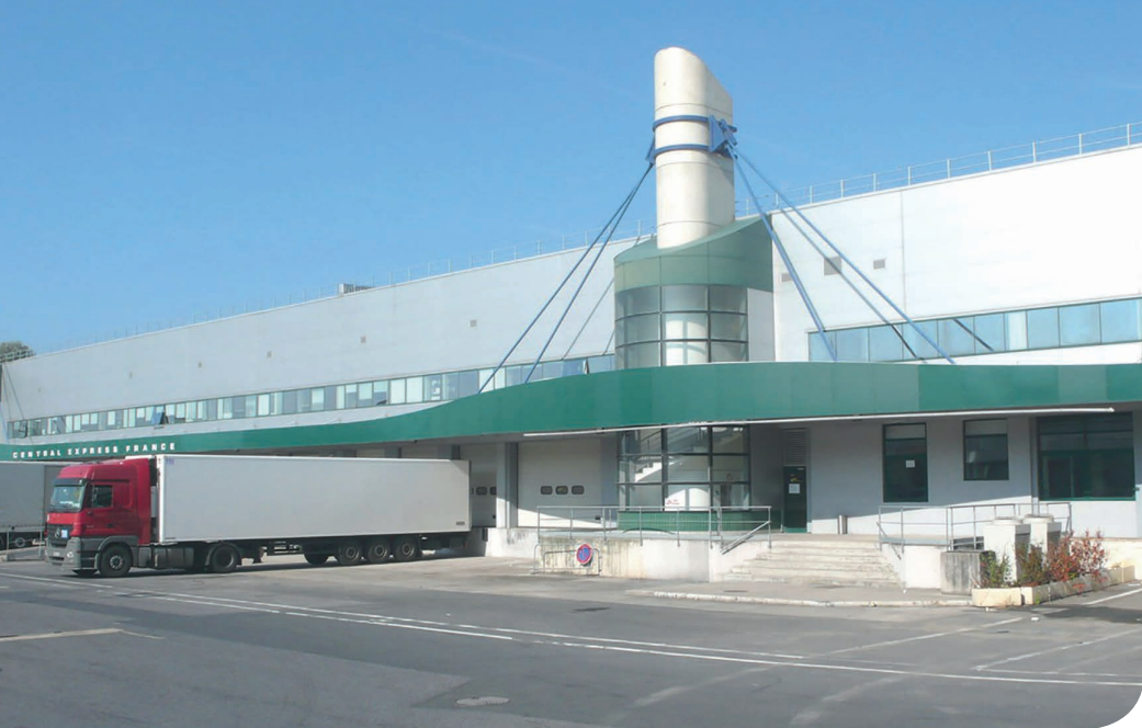
Aulnay DC 26