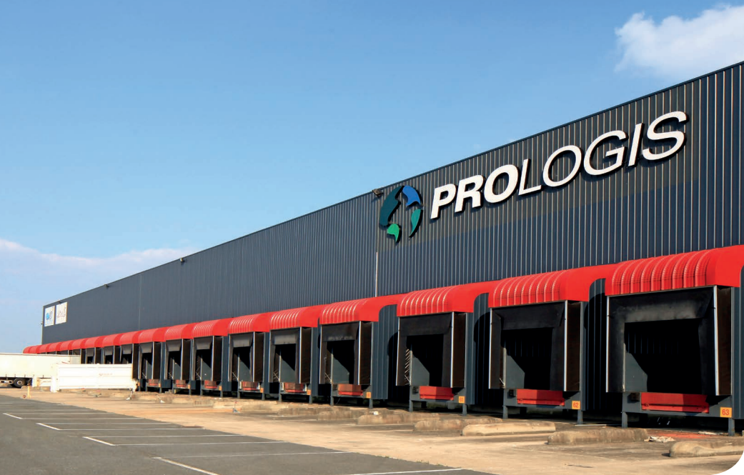
Orléans DC 7