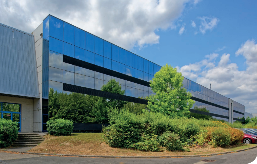
Savigny DC 1