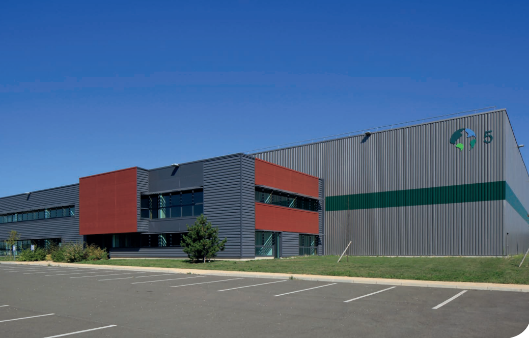
Vémars DC 5