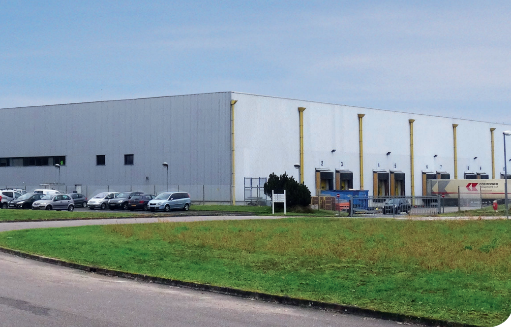
Metz DC 2