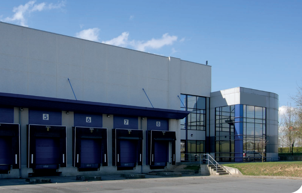
Paris Nord 2 DC 7B