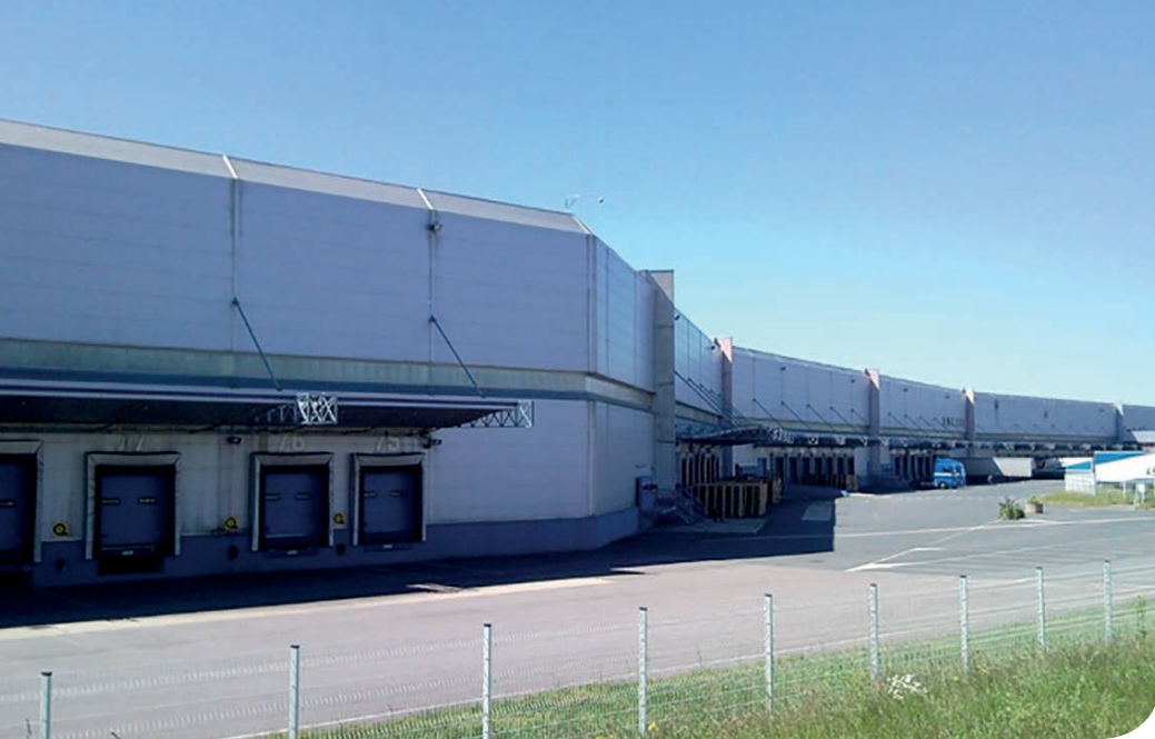
Metz DC 3