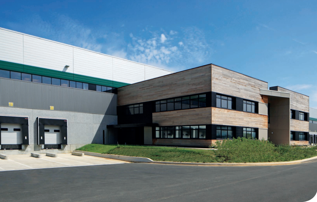
Moissy DC 10