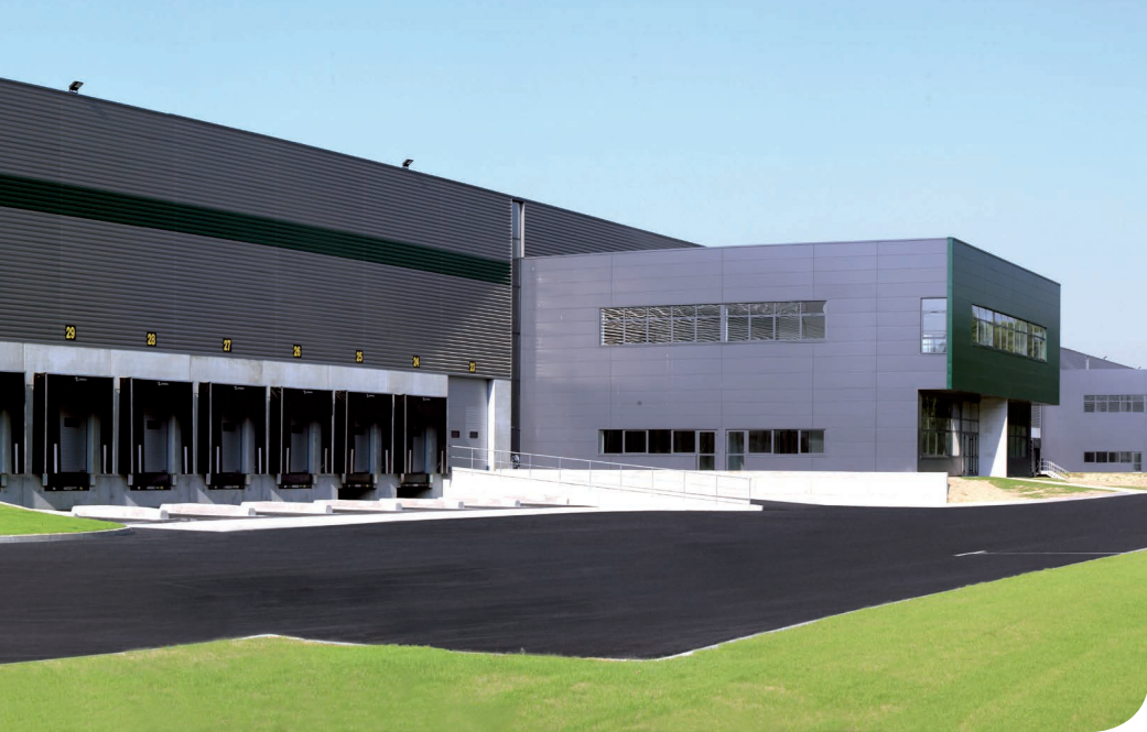
Le Havre DC 7