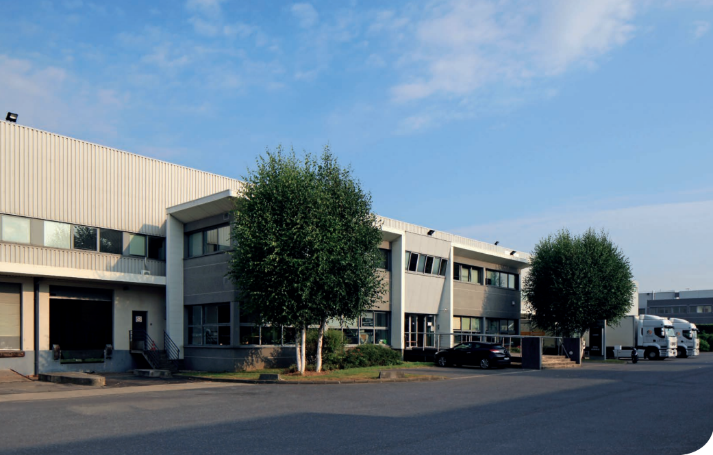
Mitry DC 11