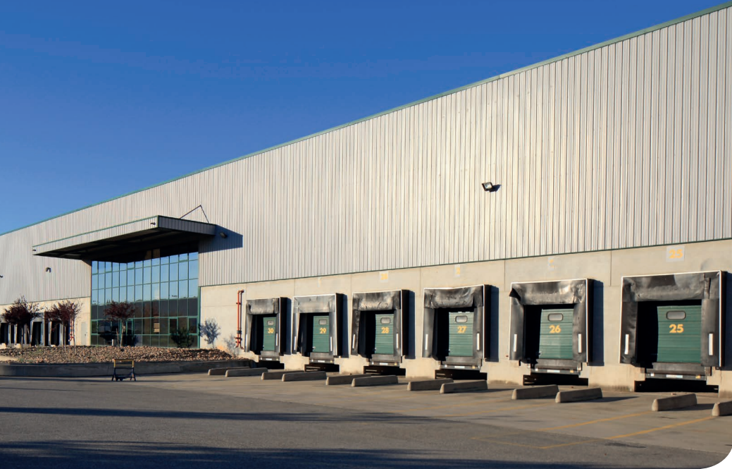
Marseille - Clesud DC 3