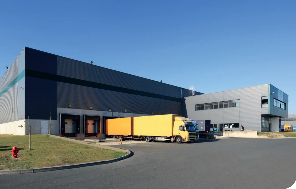
Le Havre DC 5