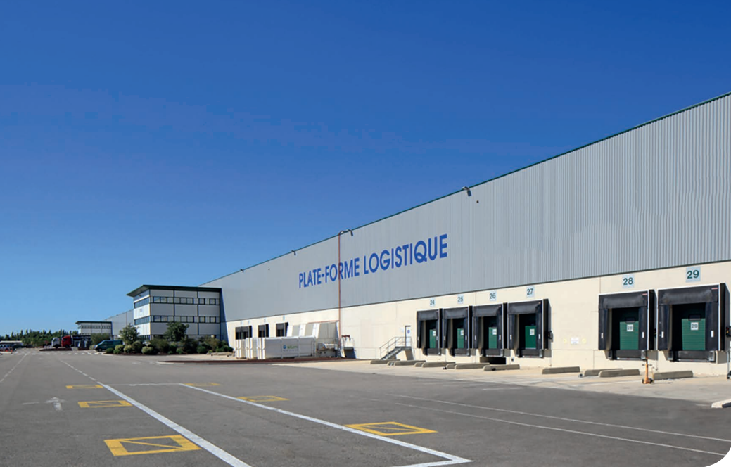
Marseille - Clesud DC 7