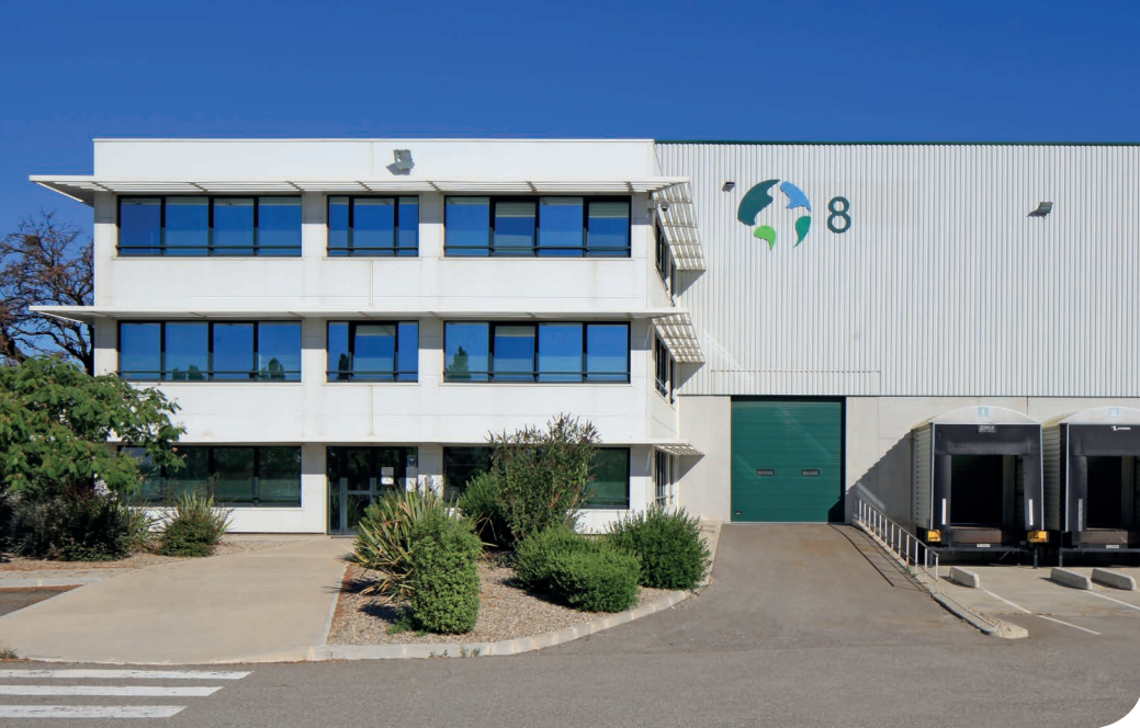
Marseille - Clesud DC 8