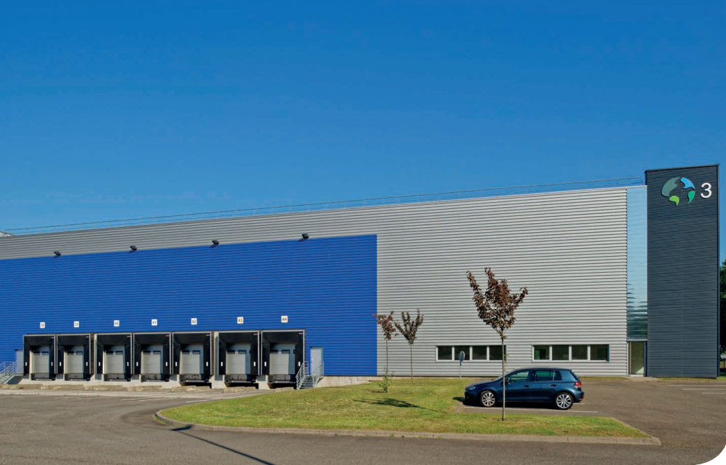
Strasbourg DC 3