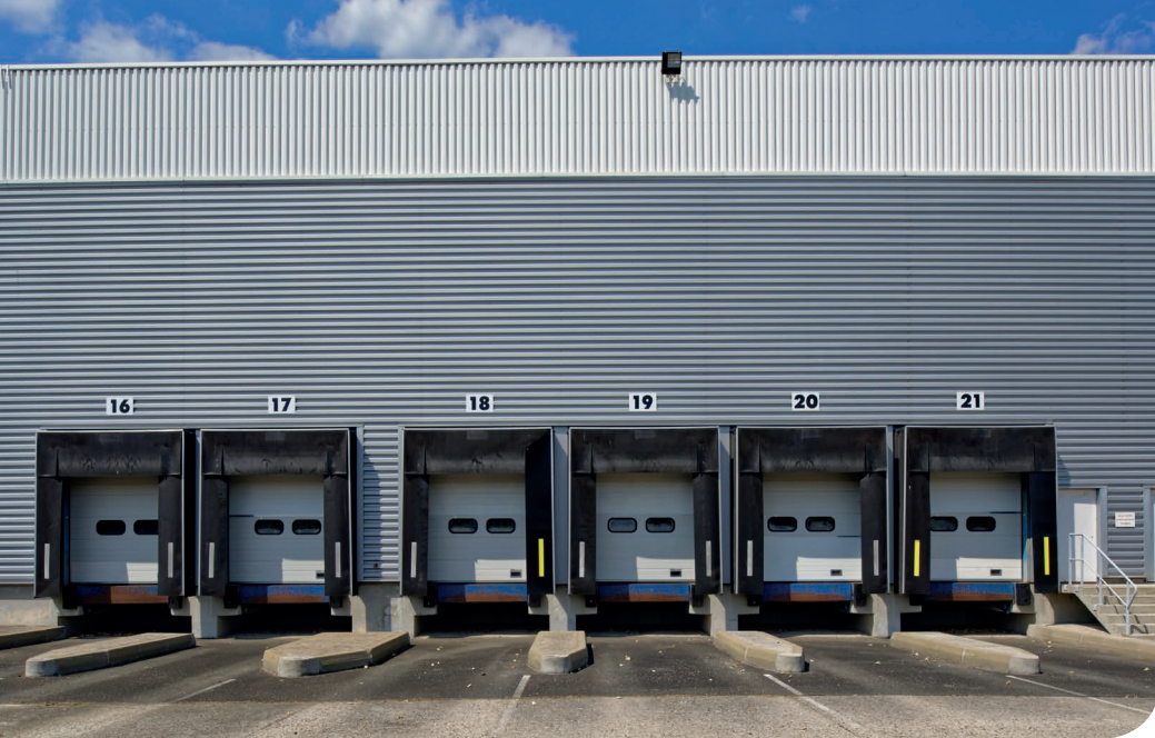
Sénart DC 1