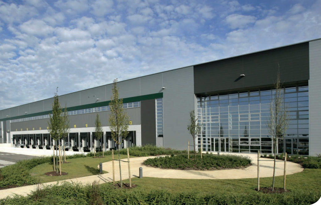
Moissy DC 4